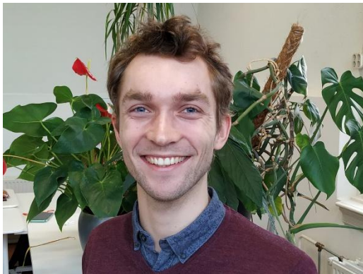
Daanjan Support Medewerker