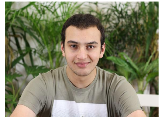
Jamal Ontwikkelaar MyWheels Platform